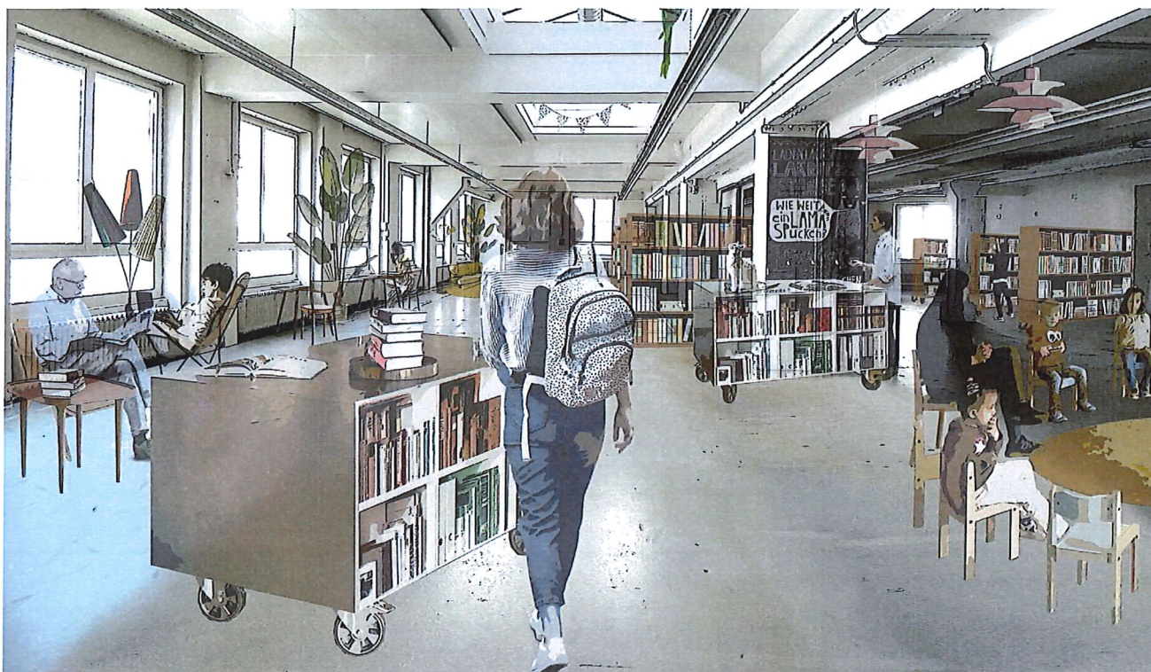
Abbildung: Visualisierung der Stadtbibliothek am temporären Standort im Effingerhof

In den vorgenannten Investitionskosten nicht enthalten sind die Kosten für einen einmaligen Medienaufbau in der Höhe von Fr. 60'000.–. Der einmalige Medienaufbau wird im Sinne einer Eigenleistung vom Verein Stadtbibliothek finanziert.