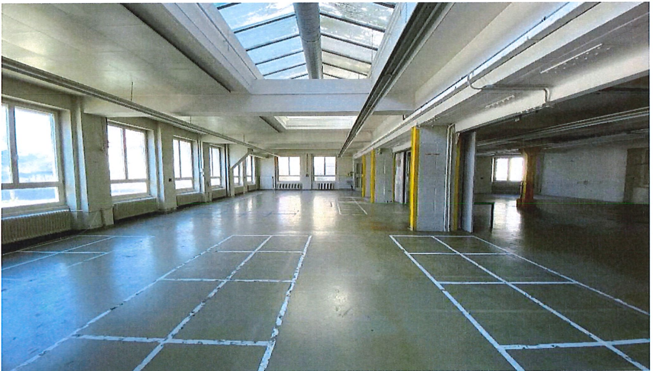
Abbildung: Räumlichkeiten Effingerhof, temporärer Standort Stadtbibliothek

Zu den Betriebskosten gehören zunächst einmal die Raumkosten. Die ausschliesslich von der Stadtbibliothek genutzte und abschliessbare Fläche umfasst 340 m 2 . Dazu kommt die mit den übrigen Mietern gemeinsam genutzte Fläche von 346 m 2 , die von der Stadtbibliothek mit einem Anteil von 27 % mitfinanziert wird. Der Quadratmeterpreis beträgt Fr. 210.– zuzüglich 17 % Nebenkosten, was zu einem jährlichen Mietzins von rund Fr. 107'000.– führt. Dabei sind für die ersten zwei Jahre aufgrund der Bauarbeiten in den oberen Stockwerken lediglich Fr. 180.–/m 2 zu bezahlen. Da zudem aufgrund der Bauinstallation 40 % der gemeinsamen Fläche temporär nicht zur Verfügung stehen, führen diese Einschränkungen zu einer Mietzinsreduktion von Fr. 25'000.– pro Jahr. Für die ersten zwei Jahre betragen die Mietkosten demnach rund Fr. 82'000.– pro Jahr.