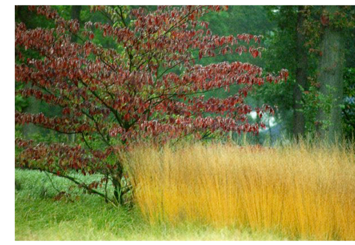
Referenz Gräser mit Sträucher