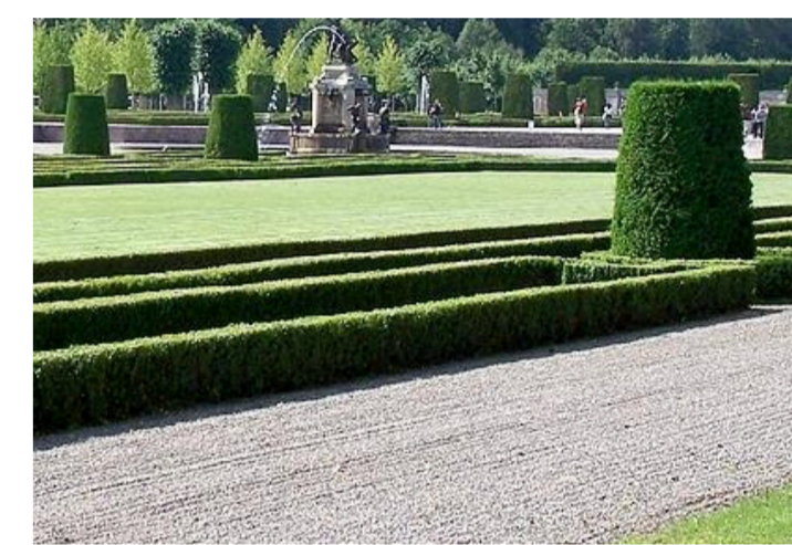
Referenz geschnittene Hecken