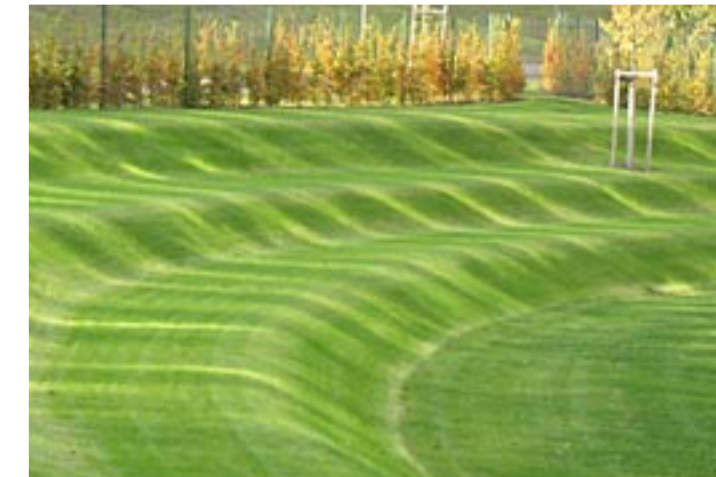
Referenz Rasenwellen Spielplatz