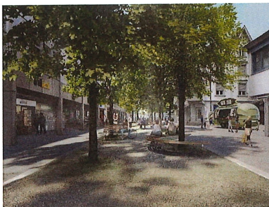
Visualisierung Mittelbereich