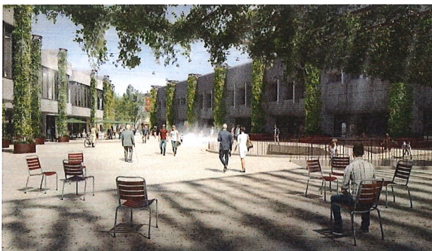
Südlicher Platz [Visualisierung: Nighthurse Images AG]