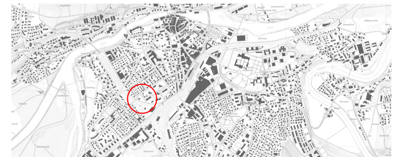
Übersichtsplan ohne Massstab