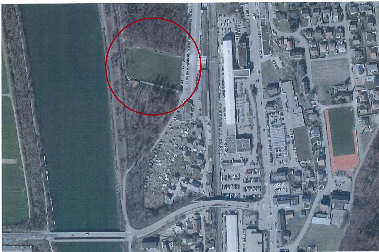
Das Rasenspielfeld in Schinznach-Bad

Das Rasenspielfeld in Schinznach-Bad befindet sich aktuell in einem relativ schlechten Zustand mit hohem Anteil an Humus. Das Spielfeld wird bei Regen rasch schmierig und muss wegen drohendem Verschleiss der Grasnarbe gesperrt werden. Bei einer Oberflächensanierung kann die eingebaute Entwässerung genutzt werden. In den Baukosten ist ein Rollrasen für eine verkürzte Bauzeit eingerechnet.