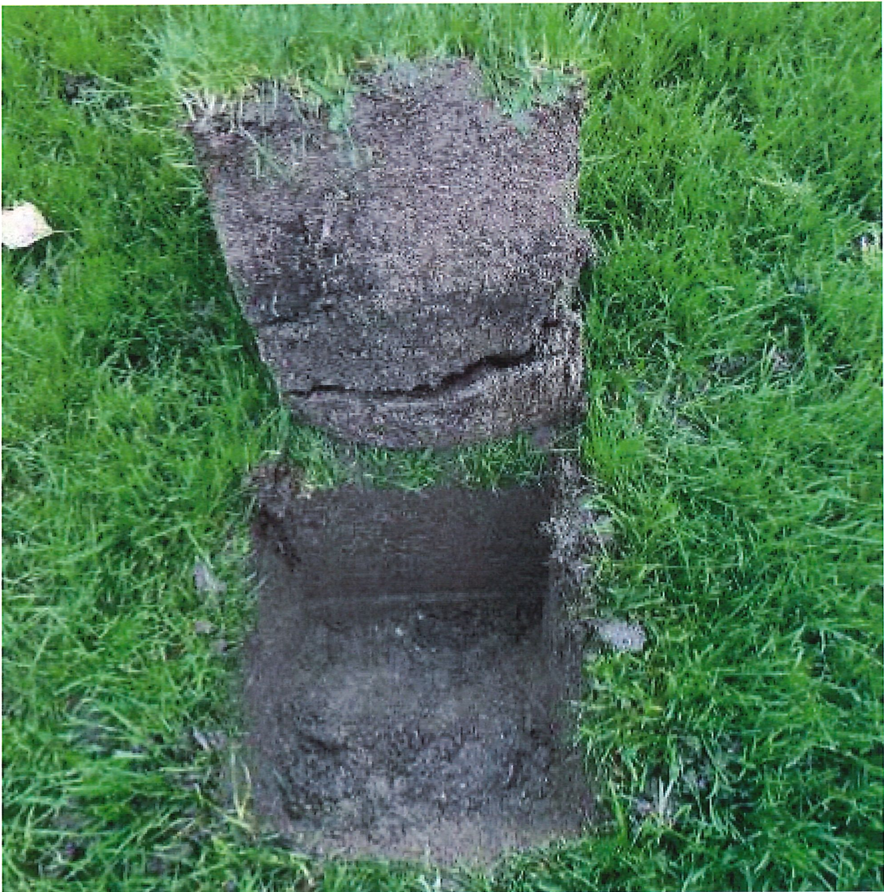
Bodenprobe Platz 3 Geissenschachen: Der Humusanteil ist deutlich zu hoch und führt leicht zu Vernässung

Der technische Aufbau der Rasenspielfelder in Brugg ist suboptimal. Mit einem Ersatz der obersten Bodenschichten von rund 40 cm und dem Einbau eines Entwässerungssystems kann die Nutzbarkeit deutlich gesteigert werden.