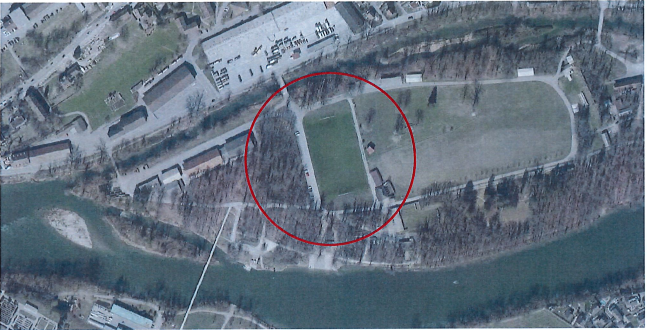
Platz 3 im Geissenschachen in der Rundbahn

Der Trainingsplatz Geissenschachen befindet sich in der Waldlichtung auf der Geissenschacheninsel. Drei angrenzende Flächen sind bewaldet. Durch die Beschattung durch den umliegenden Wald vermag der Platz insbesondere in der Randvegetationszeit nur langsam abzutrocknen.