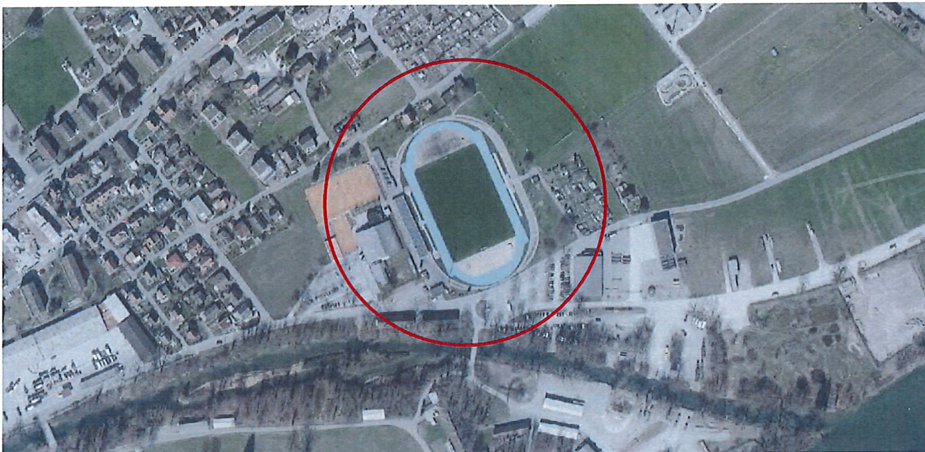
Das Hauptspielfeld im Stadion: Platz 1

Der Platz 1, im Auge der Rundbahn, ist der Hauptplatz des Stadions. Durch die unmittelbar angrenzende Garderoben-, Tribünen- und Restaurationsanlage handelt es sich um den attraktivsten Platz, der auch für Fussballmatches sehr geeignet ist. Er prägt das Prestige des gastgebenden Vereines und der Verantwortlichen für den Rasenunterhalt. Die Motivation für ein optimales Erscheinungsbild ist hoch. Nur so ist zu erklären, dass die Auslastung relativ tief ist. Eine Verbesserung der Belastbarkeit wäre von grossem Mehrwert.