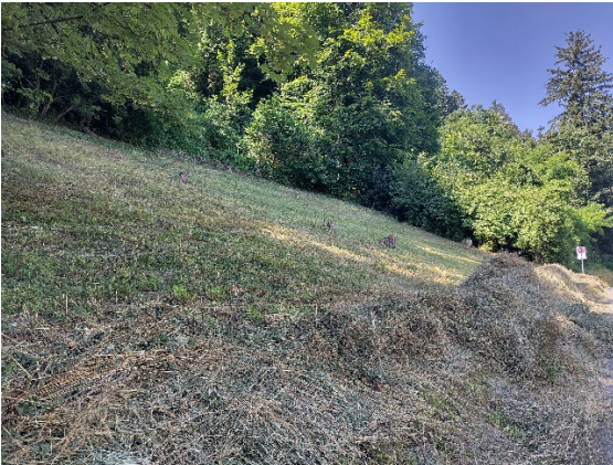
Gemähte Fläche Pigidei