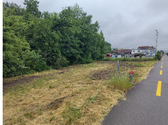
Planierte Fläche Aarauerstrasse